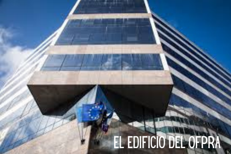
EL EDIFICIO DEL OFPRA