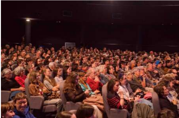
Des salles combles

repartir pour une troisième édition, d'ores et déjà en préparation, et prévue du 9 au 13 décembre 2026.