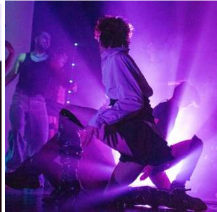
Des soirées queers